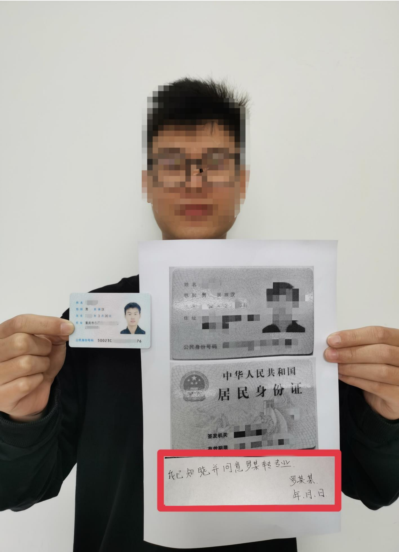
(3) 家长本人手持身份证原件及带签字的身份证复印件照片